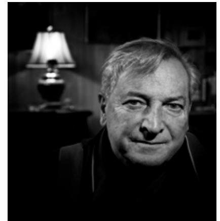
Árni Johnsen átti lítrika ævi og var mjög afkastamikill. Eftir hann liggur fjöldi greina, bóka, söngtexta og laga svo nokkuð sé nefnt.