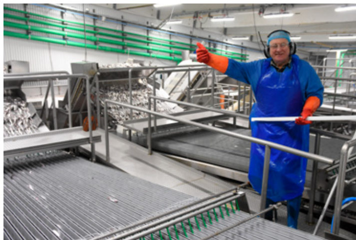
Loðnufrysting er í fullum gangi í Vinnslustöðinni þessa dagana.

vinum og einbeita okkur að stærstu og mikilvægustu aðilunum.“