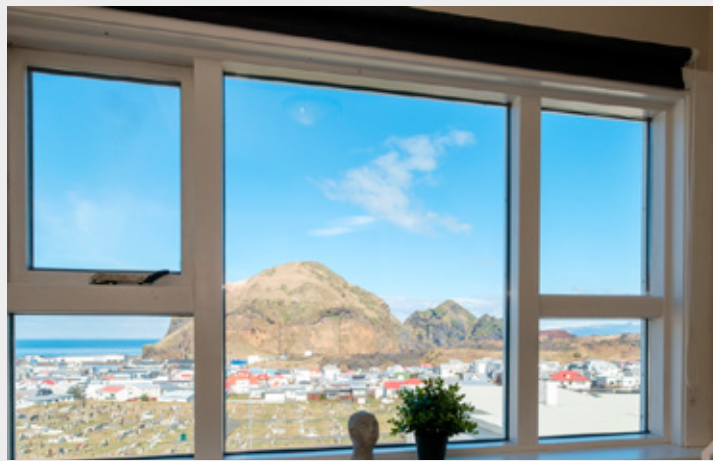
Eins og sjá má bíður eignin upp á glæsilegt útsýni.

árum, þannig að húsið í heild sinni er í mjög góðu ástandi.