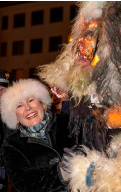
Halla forseti í faðmi eins af tröllunum sem fóru með miklum látum um bæinn á þrettándagledinni.

„Gestrisnin sem maður upplifir á Þjóðhátið er einstök,“ sagði Björn en hann heimsótti Herjólfsdal fyrst 16 eða 17 ára gamall. „Að koma sem þjakkur inn í hvítu tjöldin, vera boðið upp á rækju-samlöku og fá svo að syngja með heimafólki er alveg ógleymanlegt. En þetta andrúmsloft er ekki bara ríkjandi á Þjóðhátið. Við finnum það alltaf þegar við komum hingað, bæði fyrir og eftir forsetakjörið. Þegar við vorum í framboðsferðum árin 2016 og 2024 fundum