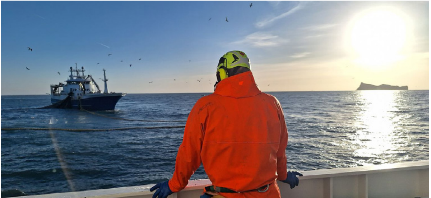
Geiri hefur verið duglegur að smella myndum af sjónum. Þessa tók hann nú í febrúar.