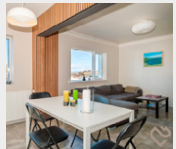
Hér má sjá stofuna.