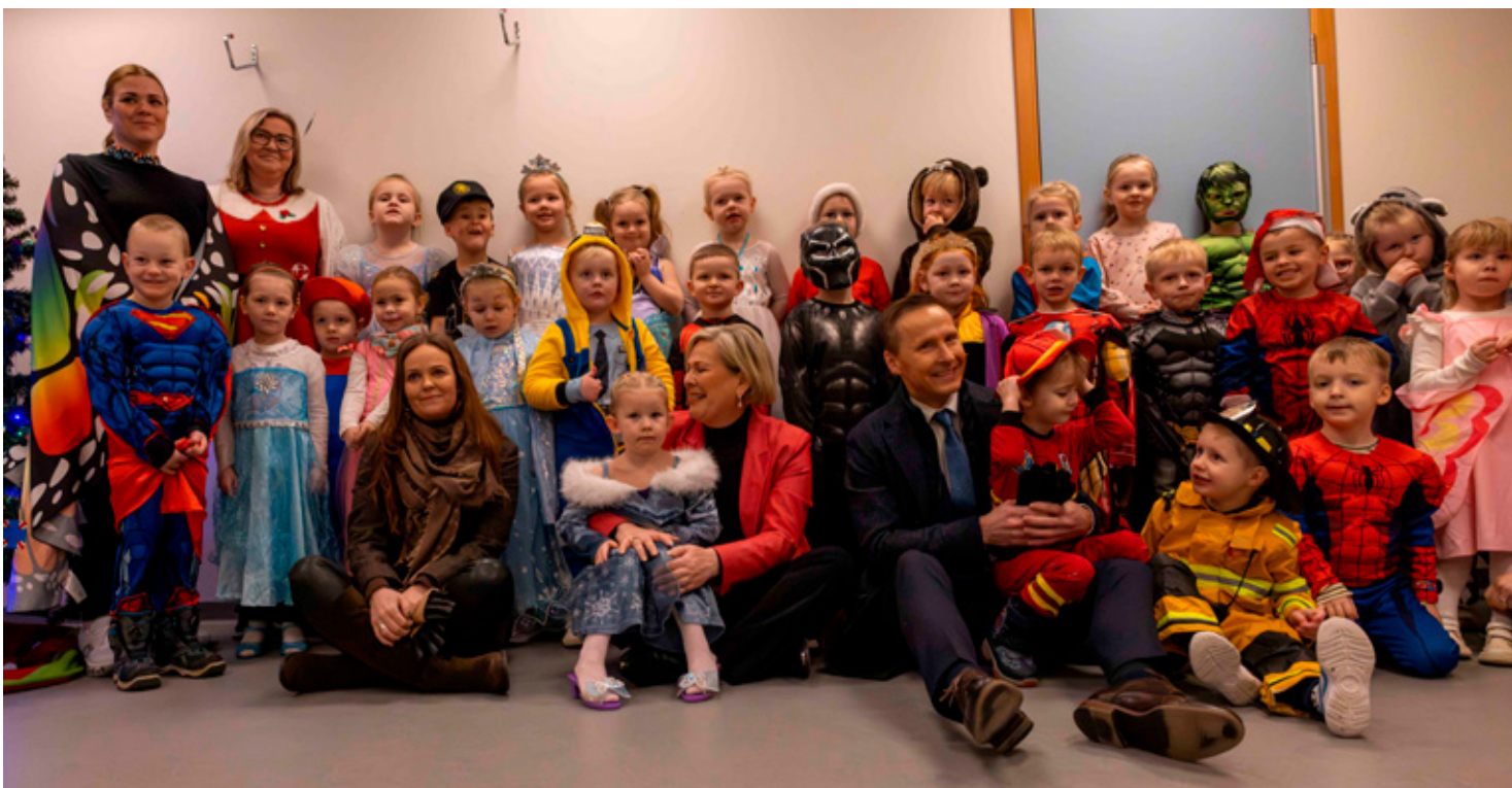
Börnin á Sóla mættu uppáklædd þegar þau tóku á móti forsetahjónunum og bæjarstjóra.