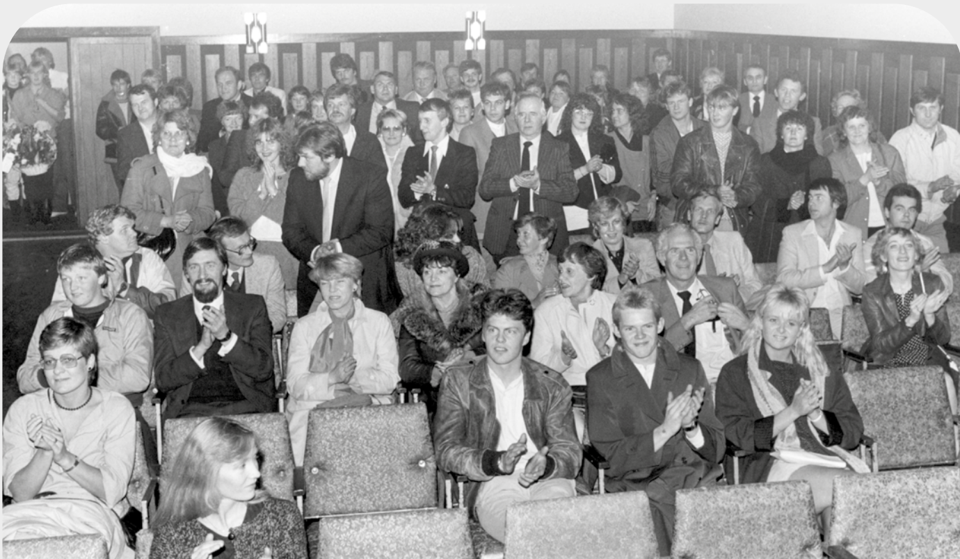
Kvikmynd þráins Bertelssonar Nýtt líf frumsýnd í Vestmannaeyjum 29. september 1983 fyrir fullu húsi.