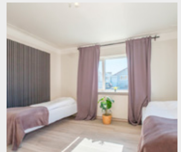
Fjögur rúmgóð svefnherbergi eru í íbúðinni.