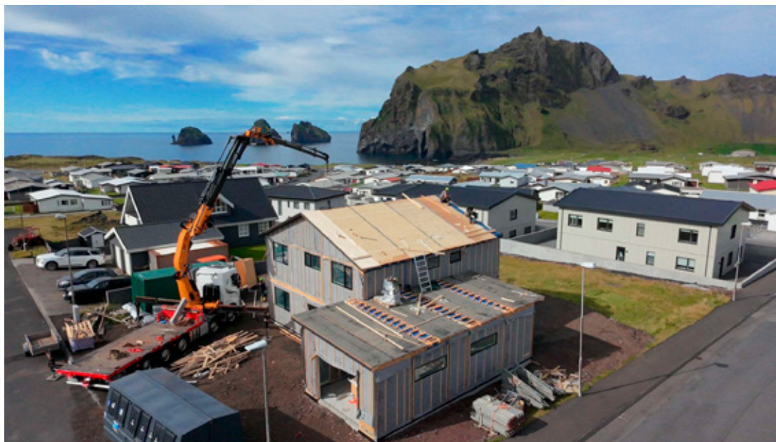
Framkvæmdirnar hafa gengið hratt og vel fyrir sig.

um að skapa meira rými fyrir fjölskylduna. Þau vildu meðal annars stærra þvottahús, stærra garð og betra aðgengi að útsvæði. „Við vorum bæði í handbolta og komin með eitt barn og því mikill þvottur. Við vorum með fínan garð, en ekki með aðgengi að honum að aftan. Ég þyrfti til dæmis að fara með barnavagn og blaut hjól í gegnum stofuna og eldhúsið.“