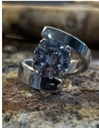
Fallegur hringur sem Pura bjó til og hannaði úr silfurskeið.

Myndir þú lýsa stílnum þínum? Stíllinn minn er eiginlega bara allskonar, ég hef ekki fest mig í neinum sérstökum stíl en ef ætti