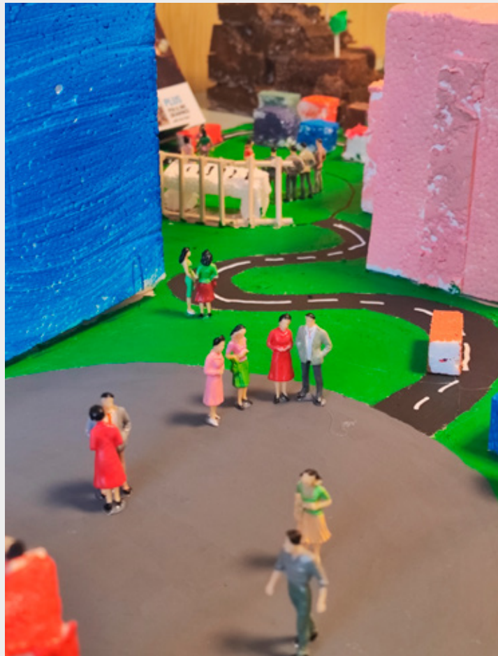
Nemendur fá pláss til að tjá hugmyndir sínar í gegnum listina og þannig efla sjálfstraust sitt til að móta framtíð sína með eigin rödd.

Eitt af því mikilvæga í áfanganum Listir og menning er að kynna nemendum samtímalist á þann hátt að hún verði aðgengileg og áhugaverð. Margir upplifa samtímalist sem fjarlægja eða jafnvel óskiljanlega en þegar hún er skoðuð í samhengi við söguna