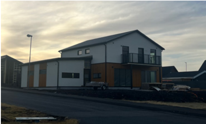
Eins og sjá má hefur mikið vatn runnið til sjávar síðan í maí.

þeirra. Það hafi ýtt undir hjá þeim og segir hún það afar ánægjulegt að hafa vinina beint á móti og vera samferða í ferlinu. „Stuðningurinn hefur skipt miklu máli,“ bætir hún við.