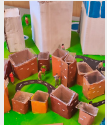
Við skoðum einnig daglega lífið í gegnum listagleraugin.

Sömuleiðis fá nemendur pláss til að tjá hugmyndir sínar í gegnum listina og þannig efla sjálfstraust sitt til að móta framtíð sína með