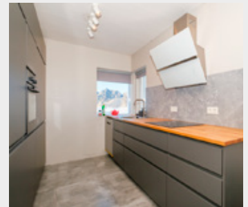
Eldhúsið er nýppgert.