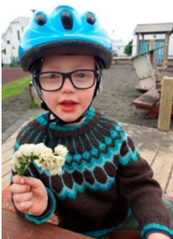
Rósa þrjónar einstaklega vandaðar og fallegar flíkur.

Það væri gaman að ná að búa til nokkra diskka sem væru aðgengilegir í kringum goslokin – en það kemur í ljós hvað gerist.