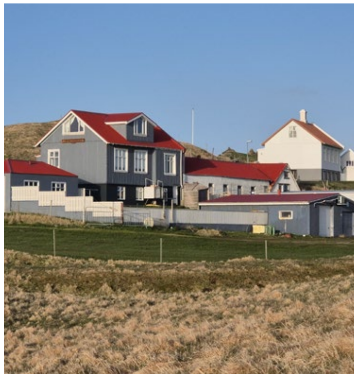
Þorlaugargerði er einn af unaðsreitum á Heimaey og þar ólst Sigurgeir upp og er kenndur við.

1. Gott / 2. Kráin / 3. Tanginn / 4. Einski kaldi