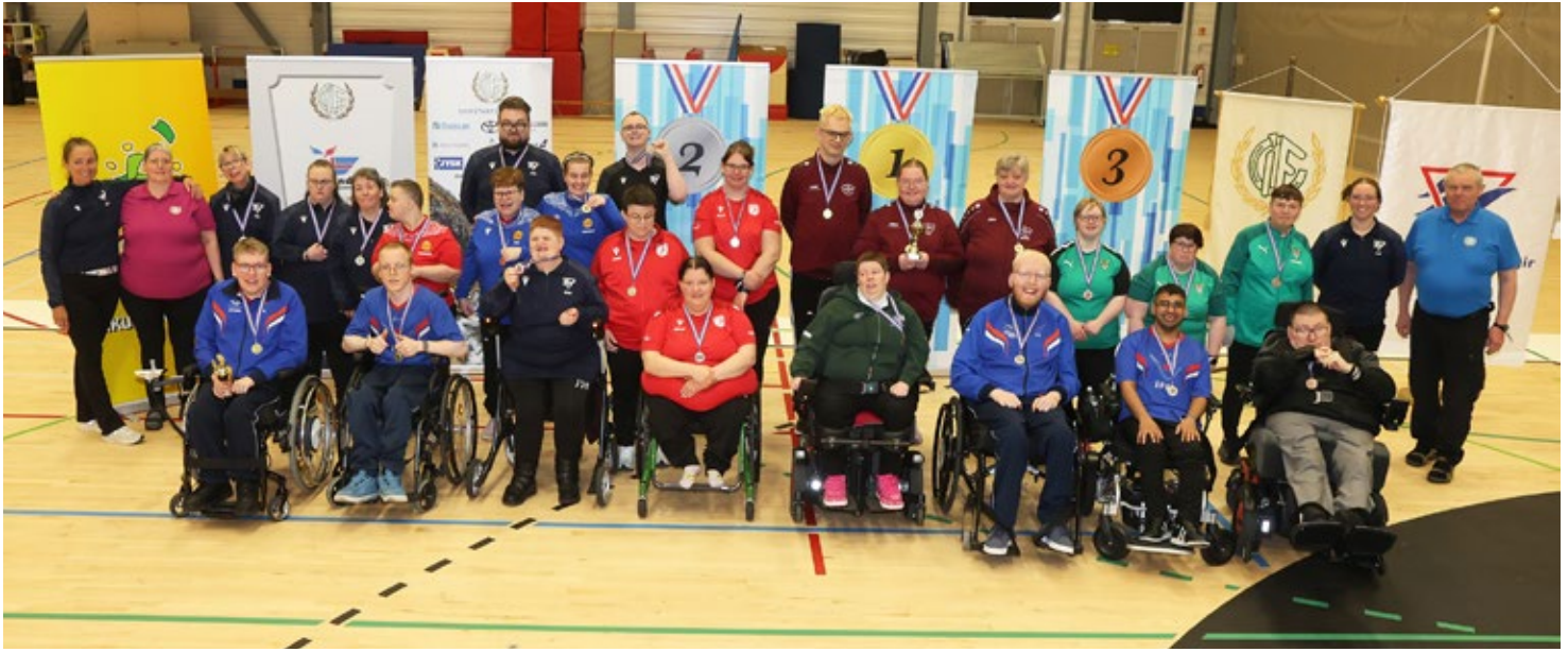
Vinningshafar á Íslandsmótinu.