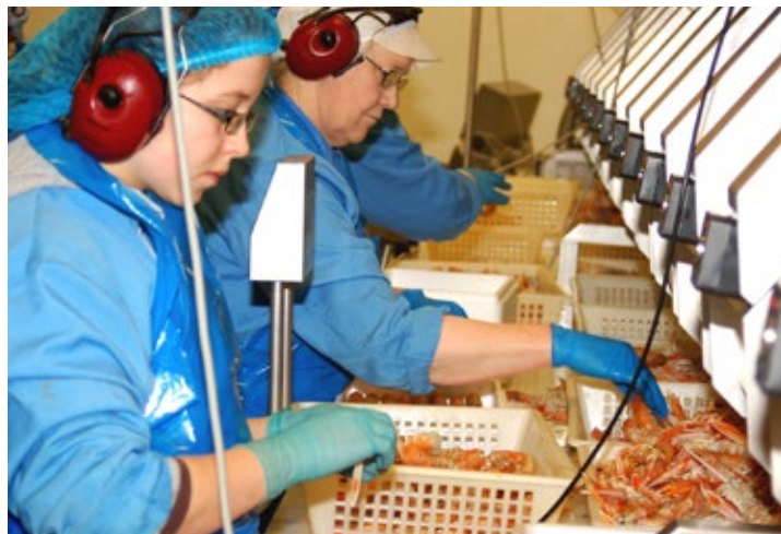
Humarvinnsla í Vinnslustöðinni. Myndin er tekin árið 2008.

in sömuleiðis vel. Að sögn Sindra Viðarssonar, sviðsstjóra upp-sjávarsviðs Vinnslustöðvarinnar, veiddu skip fyrirtækisins um 11 þúsund tonn af kolmunna.