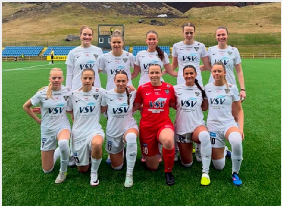
Byrjunarlið ÍBV gegn Þór/KA á sunnudaginn.