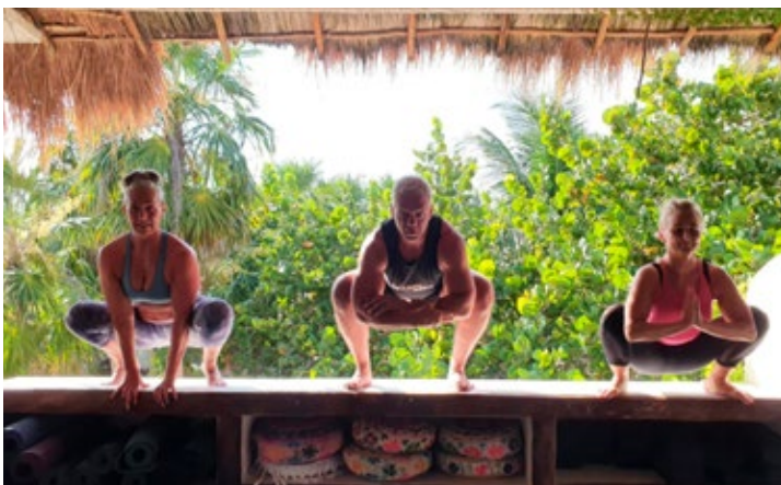
Hópurinn frá Power Yoga tilbúinn í heilsusamlega og endurnærandi viku á Tenerife.

Hún segir Hjört hafa verið aðeins víðsýnni en hún sjálf þegar kom að ferðalögum og nýrri upplifun í